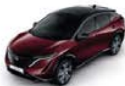
Burgundy -P- XGG