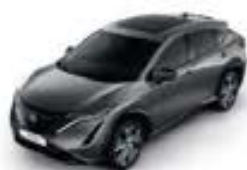
Metallic Grey -M- KAD

SS: Solid Special - M: Metalizat - P: Perlat