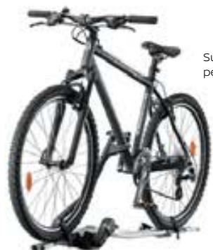
Suport bicicletă pentru plafon

Alege dintr-o gamă largă de accesorii originale pentru a-ți îmbunătăți stilul și a-ți proteja autovehiculul ARIYA. De la cârlig de remorcare până la ornamente de stilizare, covorașe exclusiviste și multe alte elemente menite să accentueze designul unic și senzația de lux ale modelului ARIYA.