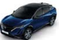
Blue Pearl -P- XGU