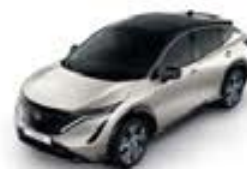
Warm Silver -M- XGV