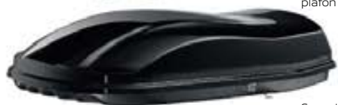
Cutie pentru plafon