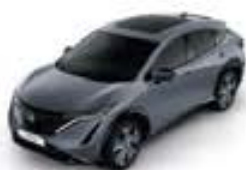
Ceramic Grey -SS- KBY