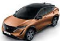
Akatsuki Copper -M- XGJ