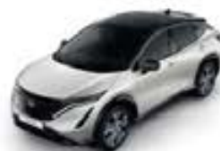
White Pearl -P- XGA