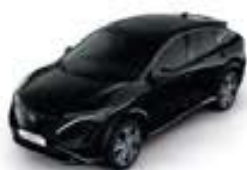
Pearl Black -P- GAT