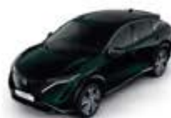
Aurora Green -P- DAP