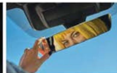
Oglindă retrovizoare fără ramă*

*Echipament disponibil în standard sau opțional (contra cost), în funcție de versiunea aleasă.