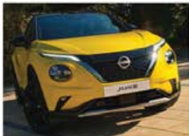
N-Sport cu ornament față argintiu*