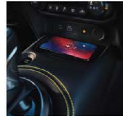
Încărcător wireless [4]