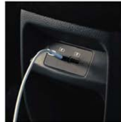
2 porturi USB în partea din spate