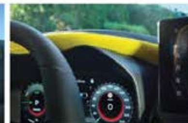
Ornament Alcantara® galben