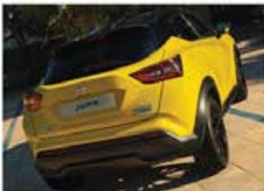
N-Sport cu ornament spate negru*