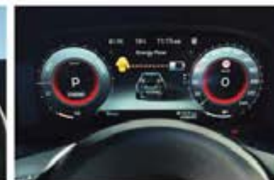
Ecran de 12,3" complet digital pe panoul de instrumente*