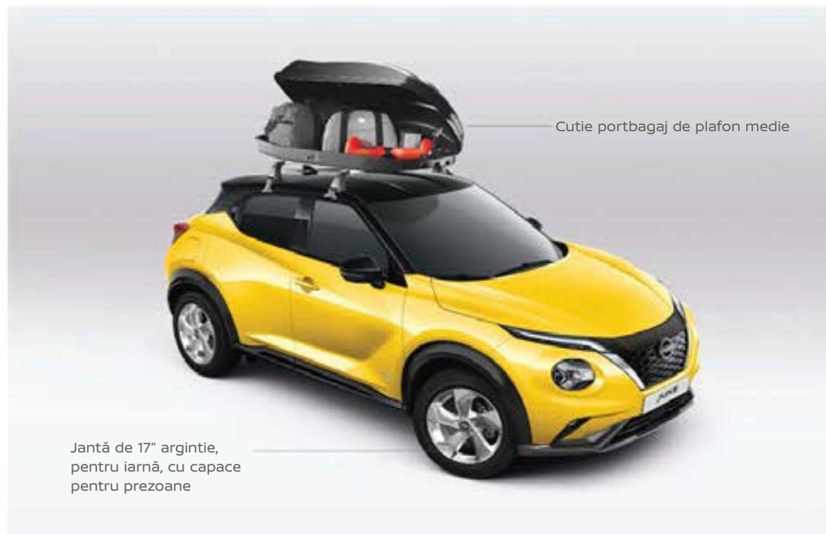
Cutie portbagaj de plafon medie