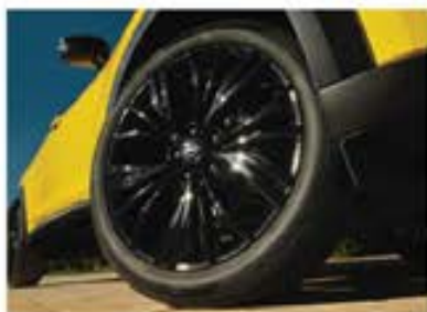
Noi jante de 19" din aliaj*