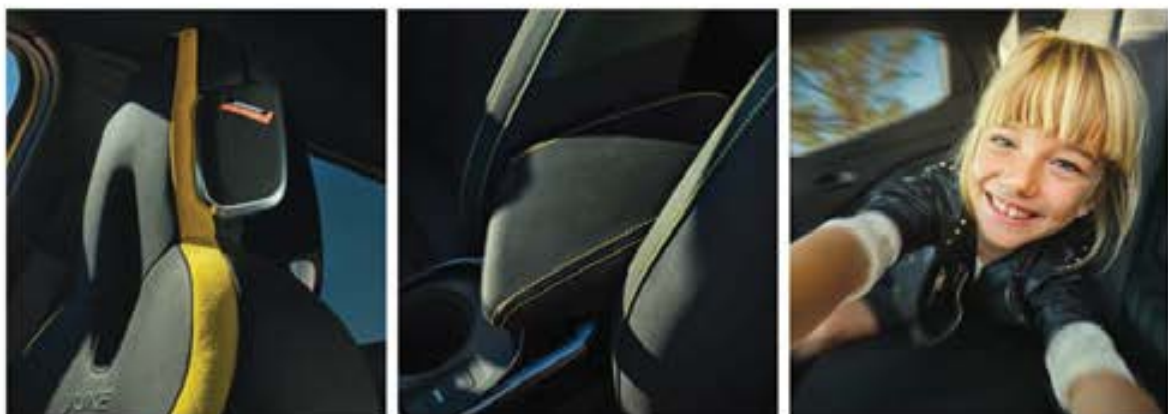
Bose® Personal® Plus*