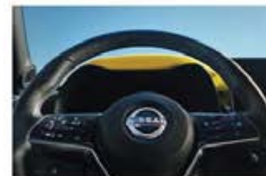
Volan îmbrăcat în piele sintetică mai moale*

Interiorul noului Juke este proiectat în jurul șoferului, de la noua consolă centrală, torpedoul de dimensiuni mai mari, ecranul infotainment* mai mare și ecranul complet digital pe panoul de instrumente* până la iluminarea ambientală*, inclusiv noul volan îmbrăcat în piele sintetică* și tapițeria Alcantara®. Așază-te într-o poziție confortabilă și bucură-te de cea mai frumoasă călătorie a vieții tale.