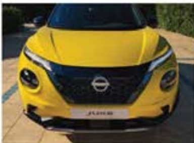
Grilă frontală (versiunea Hibrid)

Noua culoare Iconic Yellow este nuanța perfectă pentru a scoate în evidență aspectul îndrăzneț și personalitatea puternică a noului Juke. Noul nivel de echipare N-Sport este și mai bine echipat pentru a atrage toate privirile.