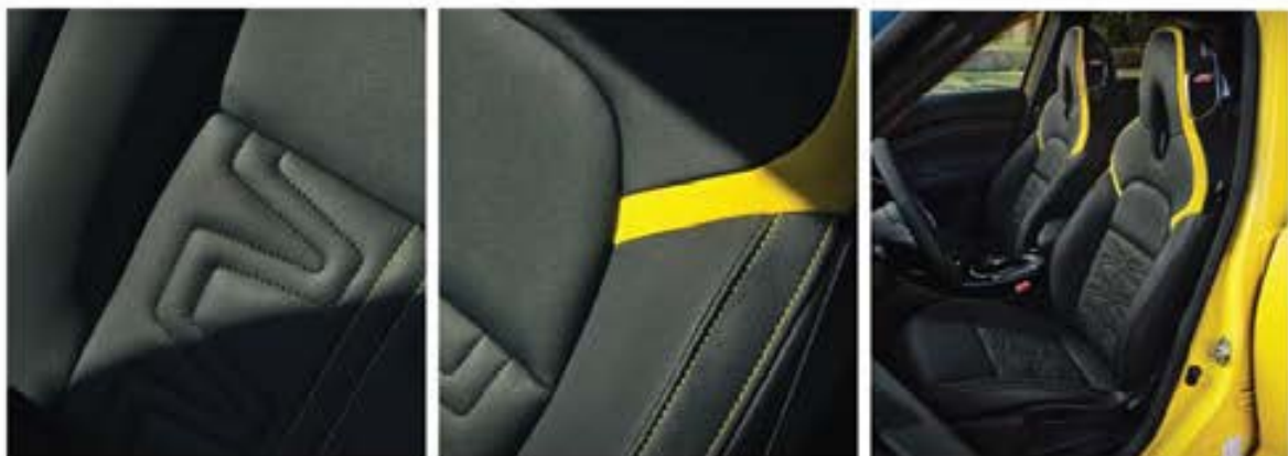
Tapițerie nouă Alcantara® matlasată negru cu galben și cusături galbene*

Interiorul versiunii Juke N-Sport este proiectat cu o atenție deosebită la detalii. Capitonajul negru premium al plafonului*, tapițeria Alcantara® matlasată negru cu galben și cusăturile galbene* scot în evidență măiestria și designul scaunelor stil monoform, care îl învâluie pe șofer pentru o experiență de conducere unică. Sistemul audio Bose® Personal® Plus cu difuzoare Ultra Nearfield integrate în tetierele scaunelor din față și 10 difuzoare Bose® amplasate strategic creează o experiență acustică desăvârșită*.