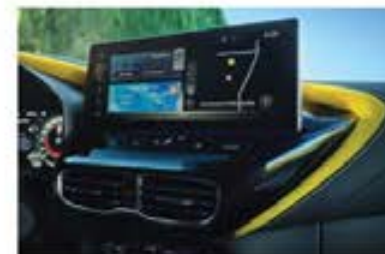
Ecran NissanConnect de 12,3**