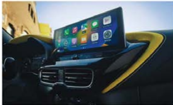
Ecran NissanConnect de 12,3" [3]

[1] Pentru a utiliza serviciile NissanConnect, ai nevoie de un cont de utilizator NissanConnect Services și să fii conectat la aplicație cu numele de utilizator și parolă. Pentru a utiliza aplicația gratuită NissanConnect Services, ai nevoie de un smartphone cu sistem de operare compatibil iOS sau Android și o cartelă SIM cu opțiune de date, cu un contract de telefonie mobilă existent sau separat între tine și furnizorul tău de servicii mobile. Funcționarea serviciilor depinde de acoperirea rețelei de telefonie mobilă. Disponibilitatea serviciilor depinde de țară, model, nivel de echipare și perioada abonamentului. Unele servicii vor fi disponibile contra cost pentru perioada de abonament detaliată în aplicația NissanConnect Services. Pentru mai multe informații, te rugăm să accesezi aplicația NissanConnect Services, site-ul Nissan, să iei legătura cu un partener autorizat Nissan sau serviciul client la adresa voceclientului.nissan@nissan-importer.com. [2] Apple CarPlay® este o marcă comercială a Apple Inc., înregistrată în S.U.A. și în alte țări. Android Auto™ și logo-ul Android Auto sunt mărci comerciale ale Google LLC. [3] Echipament disponibil în standard sau opțional (contra cost), în funcție de versiunea aleasă. [4] Pentru dispozitivele care nu sunt certificate Qi, performanța de încărcare wireless poate fi limitată.